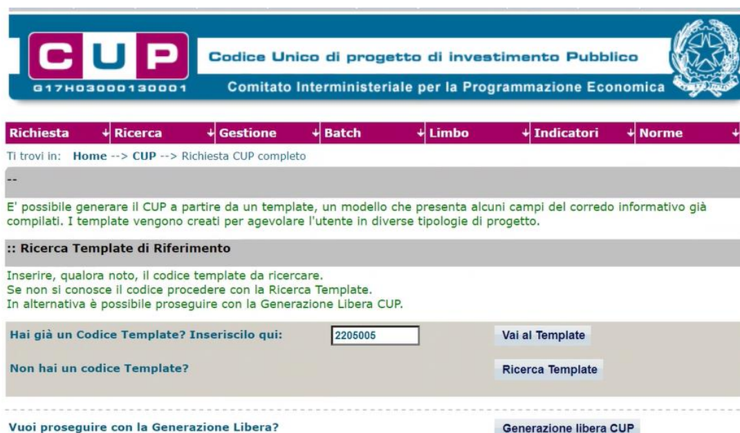
Fig. 1 – Inserimento del Codice Template

STEP 3. Seguire la procedura di generazione guidata compilando le schermate nell'ordine previsto.