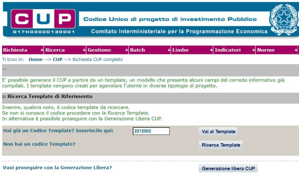
Fig. 1 – Inserimento del Codice Template

STEP 3. Seguire la procedura di generazione guidata compilando le schermate nell'ordine previsto.