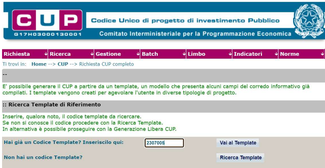
Fig. 1 – Inserimento del Codice Template

STEP 3. Seguire la procedura di generazione guidata compilando le schermate nell'ordine previsto.