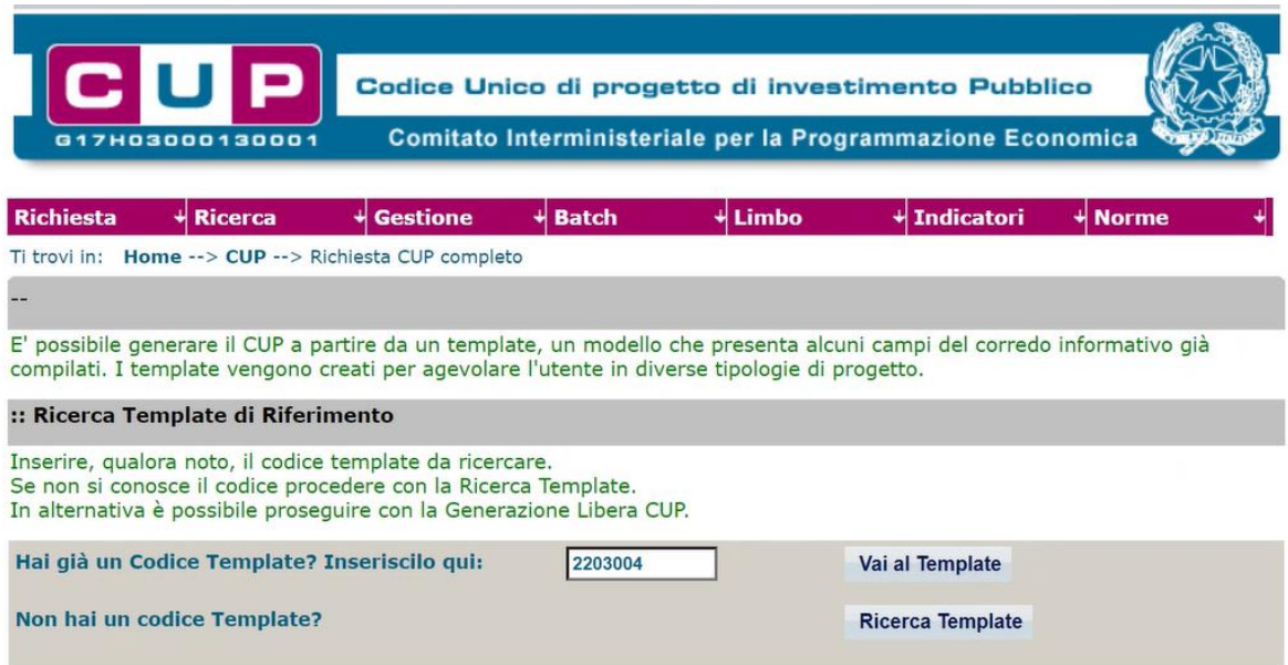
Fig. 1 – Inserimento del Codice Template