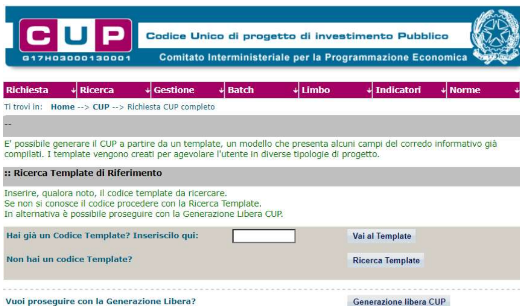
Fig. 1 – Inserimento del Codice Template

STEP 3. Seguire la procedura di generazione guidata compilando le schermate nell'ordine previsto.