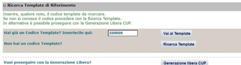
Fig. 1 – Inserimento del Codice Template

STEP 3. Seguire la procedura di generazione guidata compilando le schermate nell'ordine previsto.