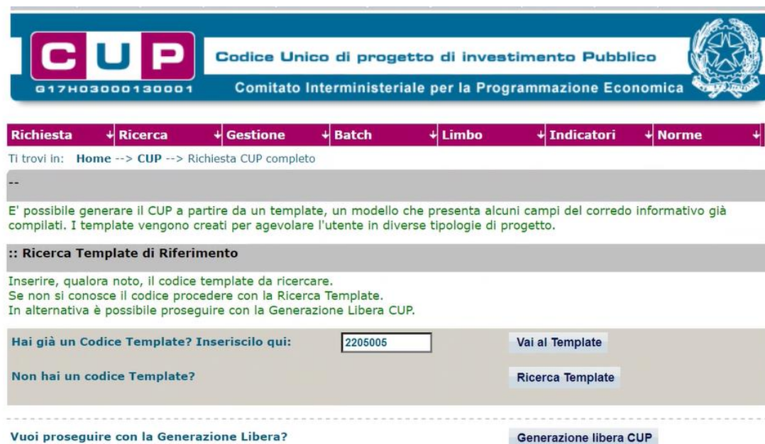
Fig. 1 – Inserimento del Codice Template

STEP 3. Seguire la procedura di generazione guidata compilando le schermate nell'ordine previsto.