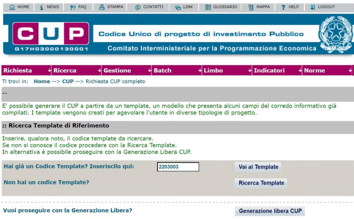
Fig. 1 – Inserimento del Codice Template